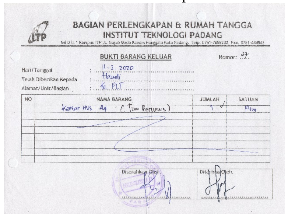
Gambar 3. Bukti Transaksi Manual

Mengumpulkan data awal berupa bukti transaksi yang menjadi dasar persiapan data. Adapun bukti transaksi secara manual pada Gambar 3.